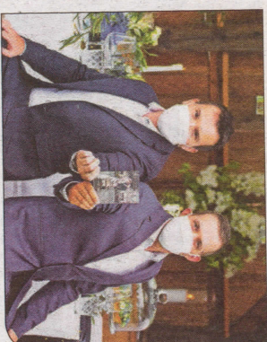
Das Hochzeitsbooklet hilft bei der Planung der Hochzeit.