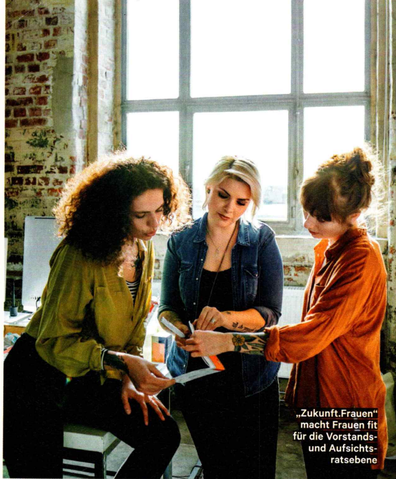
„Zukunft.Frauen“ macht Frauen fit für die Vorstands- und Aufsichtsratsebene

Die Aufsichtsrätinnen-datenbank der WKO listet kompetente Frauen auf, die sich bereits als Aufsichtsrätinnen etabliert oder einschlägige Förderprogramme absolviert haben. Ziel ist, weibliche Führungskräfte aufzulisten, um Networking zu ermöglichen. Firmen können über die Plattform gezielt nach Branchen, Standort, Namen und Aufsichtsratsausbildung filtern. Der direkte Kontakt zu den Managerinnen ist via Kontaktformular auf der Website ganz einfach möglich. www.wko.at